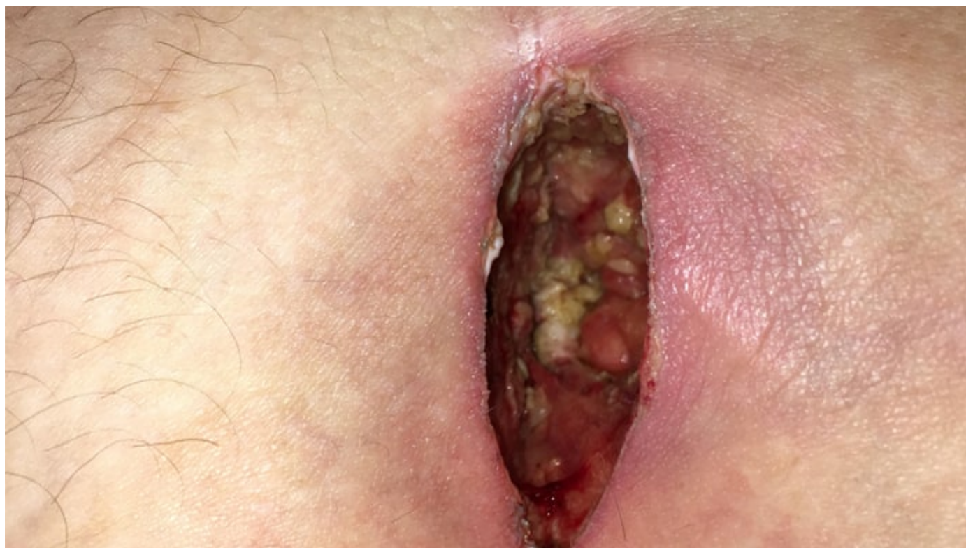
عکس عفونت کیست مویی بعد از عمل

بعد از عمل خونریزی، ترشحات خونابه ای و درد طبیعی است و معمولاً این علانم در طی چند روز برطرف میشوند. از علانم عفونت بعد از عمل میتوانیم به التهاب، تب و قرمزی اطراف زخم اشاره کنیم، در صورت تجربه چنین علانمی با پزشک خود مشورت کنید.