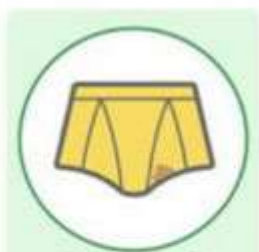
Soiling of Underwear