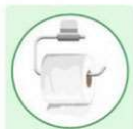
Difficulty Cleaning after a Bowl Movement