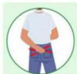
Anal and Rectal Itching