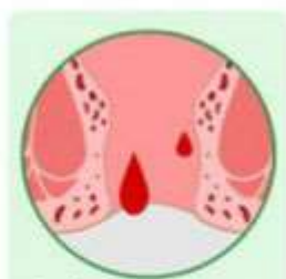
Bulging Tissue from the Rectrum